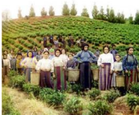
"Arbeidere ser på adelen"

Omania er det største og mest markante riket på Krameika. De fleste vil holde seg inne med Omania, det er et land med våpen og gull som hovedeksport artikler. Det er et land som eksporterer elitesoldater, velutdannet arbeidskraft og arbeidsmoral.